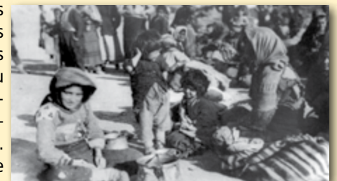
Des réfugiés arméniens cherchent de l'aide en Syrie en 1915.

Au sommet de la division contre ce projet en Europe, la commission américaine des affaires étrangères de la Chambre des représentants a voté le 5 mars pour proclamer que l'oppression turque envers les Arméniens en 1915 était un acte de génocide, et non un acte de guerre, comme le prétendent les Turques. Cela aura sans aucun doute un effet négatif sur les relations américano-turques. La Turquie depuis quelques mois a eu des relations plus étroites avec d'autres nations islamiques au détriment des Etats-Unis, de l'Union européenne et d'Israël. Ceci est susceptible de continuer.