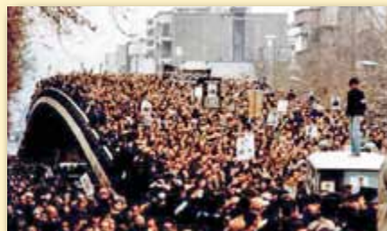
Manifestation d'étudiants à Téhéran pendant la révolution de 1979.

L'Iran a été sous la domination des fondamentalistes islamiques depuis 1979 et cherche maintenant à acquérir des armes nucléaires, ce qui modifierait radicalement l'équilibre des pouvoirs