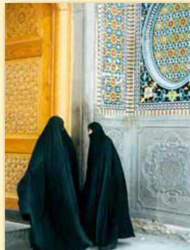
Des femmes chiites entrant dans une mosquée à Qom, en Iran.