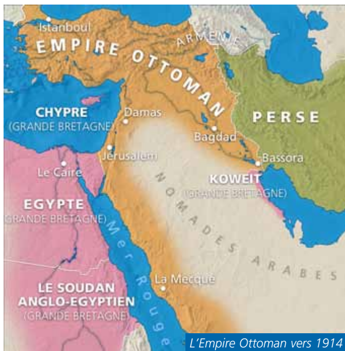
L'Empire Ottoman vers 1914