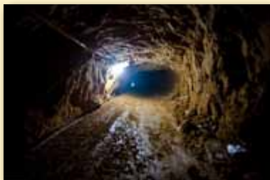
Un tunnel de contrebande reliant l'Egypte à Gaza.

Al-Qaïda, l'organisation terroriste responsable de l'attaque du 11 septembre 2001 aux Etats-Unis, est d'origine sunnite radicale. Elle fonctionne à l'est de l'Iran au Pakistan et en Afghanistan. Les anciens dirigeants de l'Afghanistan, les talibans, ont donné refuge à Al-Qaïda avant, pendant et après les attentats du 11 septembre, mais ont été battus lors de l'invasion du pays sous le commandement américain, plus tard la même année. Pourtant, les talibans continuent à se battre contre les forces de la coalition dans le pays.