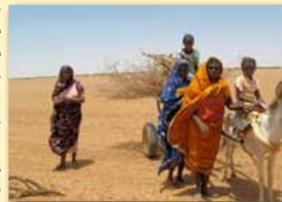
Des femmes soudanaises déplacées collectent du bois pour la cuisine.

L'islam radical a premièrement gagné l'attention du monde dans les temps modernes pendant la révolution iranienne de 1979 qui a renversé le schah pro-occidental de l'Iran. L'Iran est devenu une république théocratique sous la domination des ayatollahs et des chefs religieux. L'influence de l'Iran s'est répandue un peu partout, même dans l'islam sunnite.