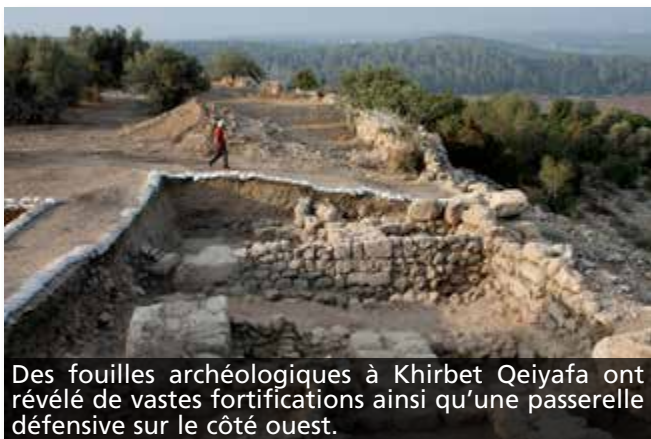
Des fouilles archéologiques à Khirbet Qeiyafa ont révélé de vastes fortifications ainsi qu'une passerelle défensive sur le côté ouest.

depuis longtemps que les rois Saül, David et Salomon furent des figures mythiques inventées par Israël pour renforcer son histoire. La découverte de la stèle de Tel Dan