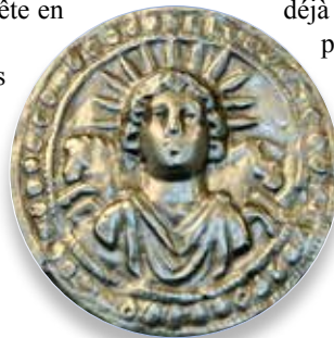
Cet ancien disque d'argent romain représente Sol Invictus, le dieu du soleil romain dont l'anniversaire était célébré chaque année le 25 décembre, date adoptée plus tard pour la fête de Noël.

Noël est aujourd'hui un mélange de faux enseignements religieux et de mercantilisme. Ajoutez à cela quelques nouveaux concepts