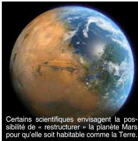
Certains scientifiques envisagent la possibilité de « restructurer » la planète Mars pour qu'elle soit habitable comme la Terre.

simultanément l'objet de tests à des fins de comparaison. Comme l'explique un article récent du New Yorker , il s'agit en quelque sorte d'une première étape vers « Mars et d'autres planètes », soit, pour commencer, une mission habitée vers Mars et, plus tard, la colonisation de Mars et d'autres planètes (Elizabeth Kolbert, « Project Exodus: What's Behind the Dream of Colonizing Mars ? », 1 er juin 2015).